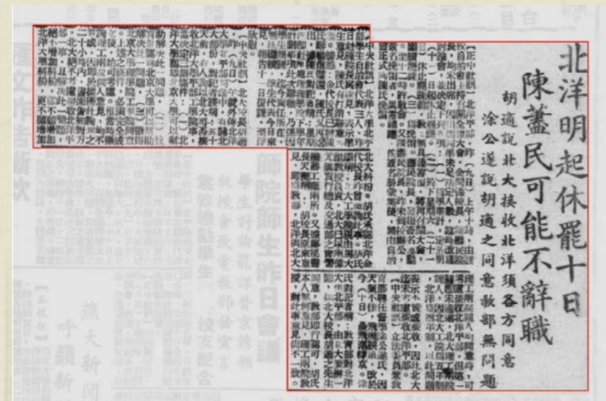
篇目检索后可在版面上精准定位，并可单独下载该篇目。

本数据库因为有国家图书馆海量馆藏的支撑，具备强大的更新能力和平台优势，计划于2019年增加到200种报纸，110万版；2022年将建设到500种报纸、500万版，基本涵盖民国时期所有重要的报纸，成为覆盖全面的近代报纸数据库。